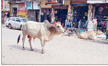
भिवानी। शहर की सड़कों पर विचरते आवारा पशु तथा आवारा पशु पकड़ते नप कर्मचारी।

अब शहर व राहगीरों के लिए राहत भरी खबर। अब शहर के लोगों तथा शहर के विभिन्न रास्तों से गुजरने वाले लोगों को आवारा पशुओं की समस्या से छुटकारा मिल जाएगी। चूंकि नगर परिषद ने शहर के विभिन्न चौक व चौराहों पर खड़े आवारा पशु तथा विभिन्न इलाकों से नंदी(सांड) पकड़ने का अभियान शुरू कर दिया। नप ने