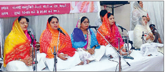
भिवानी। मुक्ति पर्व समागम में प्रस्तुति देती महिलाएं।