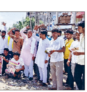
हत्यारोपियों की गिरफ्तारी की मांग को लेकर प्रदर्शन करते हुए।