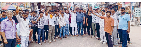
लोहारू। बंद पड़ा लोहारू का बाजार।