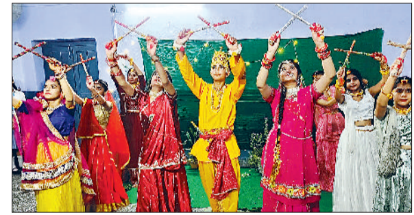
भिवानी। श्री कृष्णजन्मोत्सव पर कार्यक्रम की प्रस्तुति देते बालक।